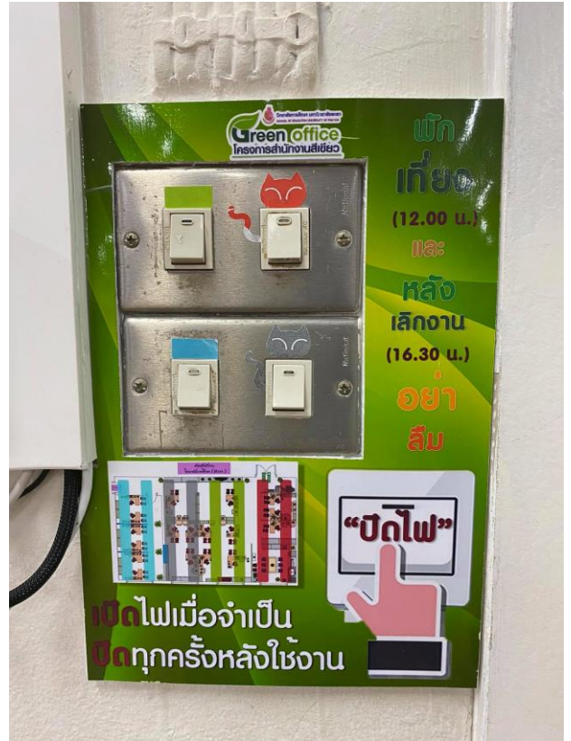
การปิดไฟเวลาพักกลางวัน