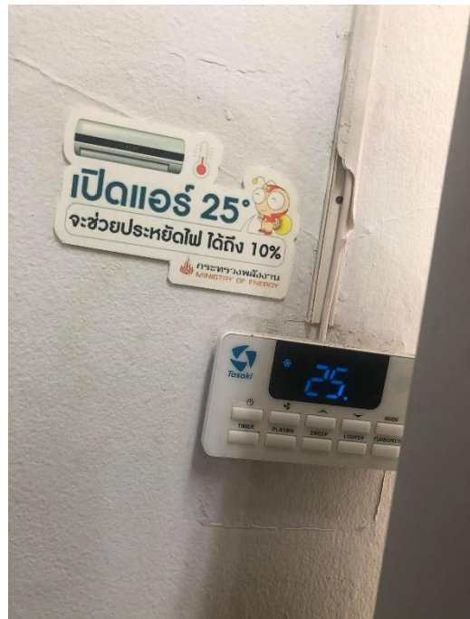
การปรับอุณหภูมิเครื่องปรับอากาศที่ 25 °C